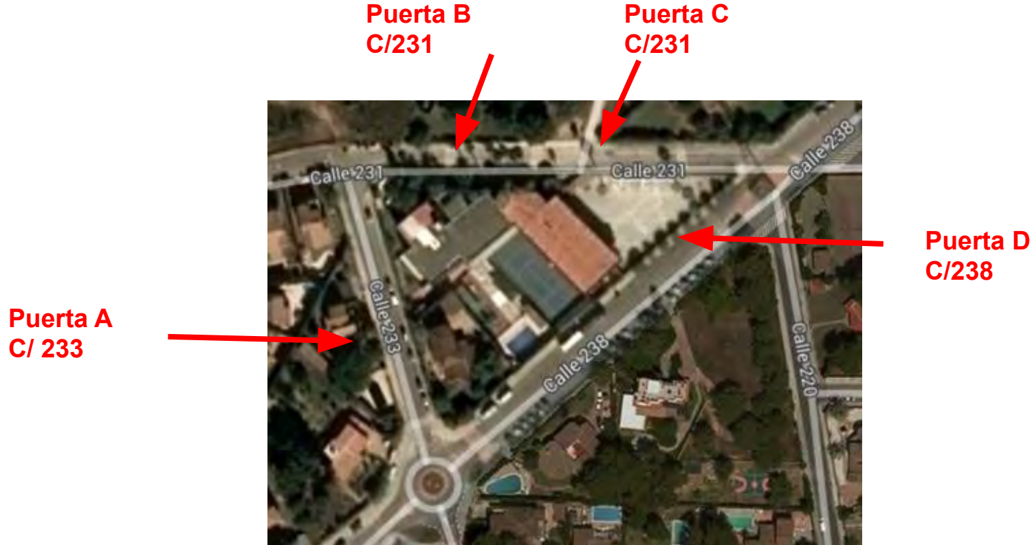
Plano 1. Accesos Edificio Primaria