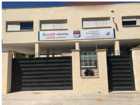
Puerta E (C/238)

Entrada: alumnos que SÍ usen transporte escolar