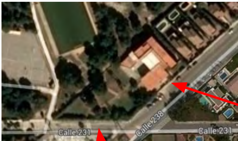
Plano 2. Accesos Edificio Secundaria