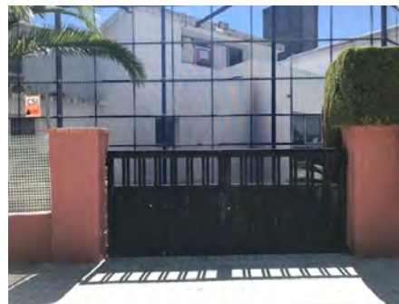
Puerta B (C/ 231) Entrada y salida para: Nursery y Reception