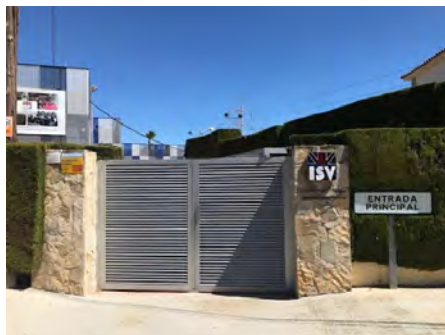
Puerta A (C/ 233) Entrada y salida para: Year 1, Year 2, Year 3, Year 4 y Year 5