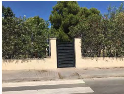
Puerta F (C/ 231)

Salida: Alumnos que NO utilicen transporte escolar