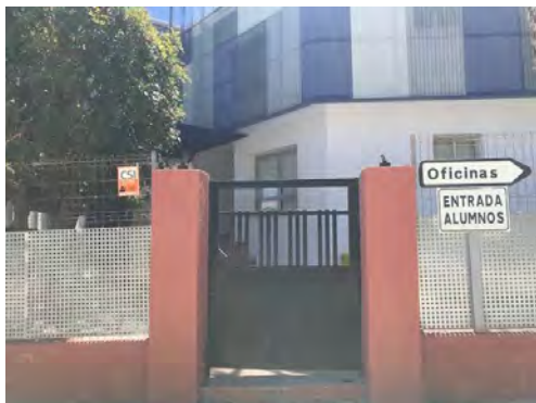
Puerta C (C/ 231) Entrada y salida para: Year 6, Year 7 y Year 11